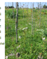
Foto 1 – Orchidee selvatiche minacciate da piante di ailanto

La diffusione dell’ailanto può causare enormi danni sia per gli ecosistemi sia per la salute umana, questa va dunque controllata per preservare i nostri paesaggi, gli ambienti naturali e tutte le specie autoctone