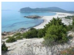
Illustrazione 1 – Il territorio del SIC ITB040020: spiaggia di Porto Giunco e sullo sfondo il promontorio di Capo Carbonara (Padda).

Gli habitat prioritari del progetto sono l’habitat marino “Praterie di Posidonia oceanica” (1120*) e gli habitat terrestri “Dune costiere con ginepri” (2250*) e “Dune con foreste di pini” (2270*) della Direttiva 92/43/CEE (“Habitat”). Tali habitat risultano vulnerabili e seriamente minacciati dalle attività correlate all’azione dell’uomo, quali l’urbanizzazione, l’utilizzo dei litorali a scopo turistico e ricreativo, le attività di pulizia delle spiagge con mezzi meccanici, le attività legate al mare come il traffico